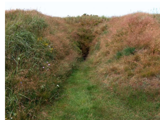
Blakshøjs indgang.

Der bliver en lille pause at strække benene i.