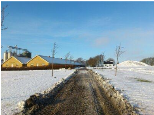
Bønder i Nordjylland gennem 5000 år. Den moderne Blakshøjgård t.v. og stenalderens snedækkede Blakshøj jættestue t.h.

Der kan være 20 tilhørere i jættestuen ad gangen. Når der er fyldt op til den første koncert, kan man melde sig til den næste 1½ time senere samme dag.