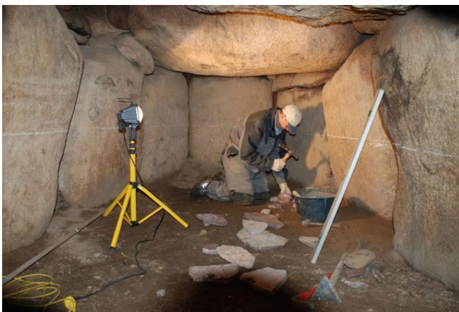
Restaurering af gravkammeret i Blakshøj 2009.

Der hugges tømursfliser til mellemrummene mellem bærestenene.